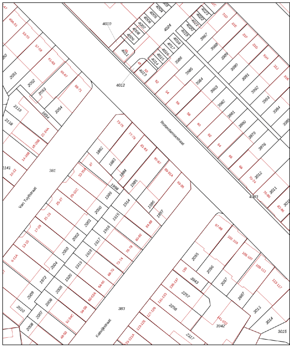
Kadastrale kaart Uw referentie: Rotterdamse 85 A

DEZE PLATTEGRONDEN ZIJN MET DE GROOTSTE ZORG SAMENGESTELD EN DIENEN TER INDICATIE. ER KUNNEN GEEN RECHTEN AAN WORDEN ONTLEEND.