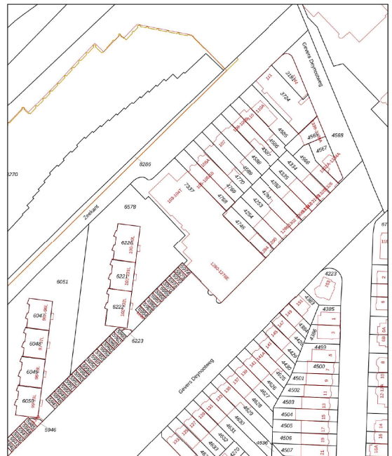
Kadastrale kaart Uw referentie: zeekant 103

DEZE PLATTEGRONDEN ZIJN MET DE GROOTSTE ZORG SAMENGESTELD EN DIENEN TER INDICATIE. ER KUNNEN GEEN RECHTEN AAN WORDEN ONTLEEND.