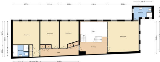
[MOLENSTRAAT 21B | 1e verdieping | Hoogte 2.90m/2.98m]