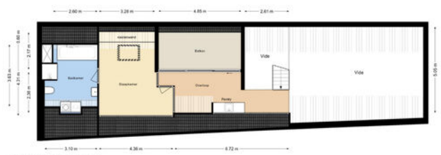
[MOLENSTRAAT 21B | 2e verdieping | Hoogte 2.08m]