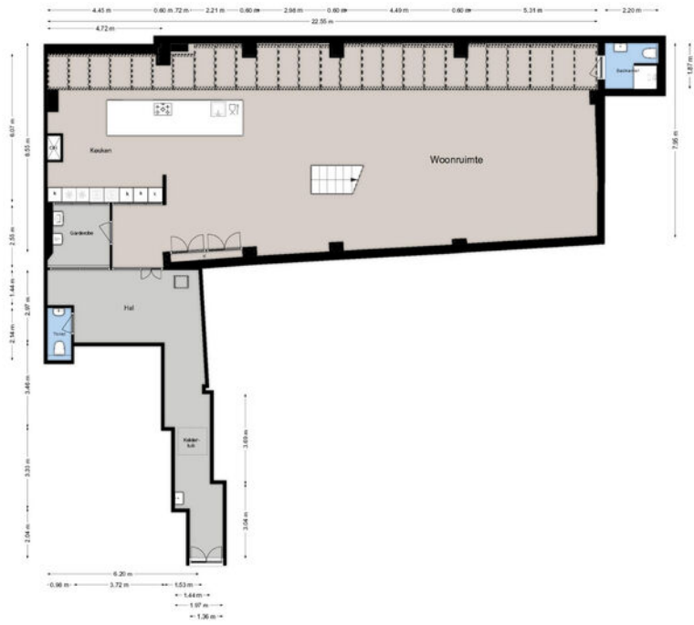
[MOLENSTRAAT 21B | Begane grond | Hoogte 3.85m]